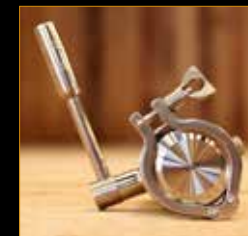
Salida de claros