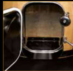
Puerta de vaciado total*