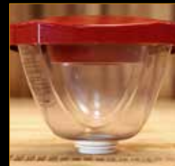
Piquera aséptica 4.5 L