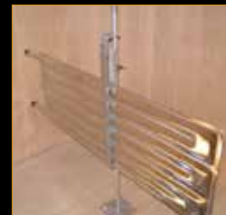
Placa de refrigeración *