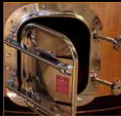
Puerta rectangular *

El diseño se adapta a cada necesidad, tanto para la vinificación como para la crianza de vinos o licores, gracias a una amplísima gama de accesorios específicos y únicos.